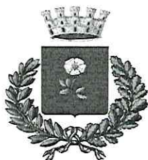
CITTÀ di AULLA