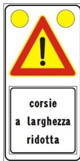
Figura II 391c Art. 31