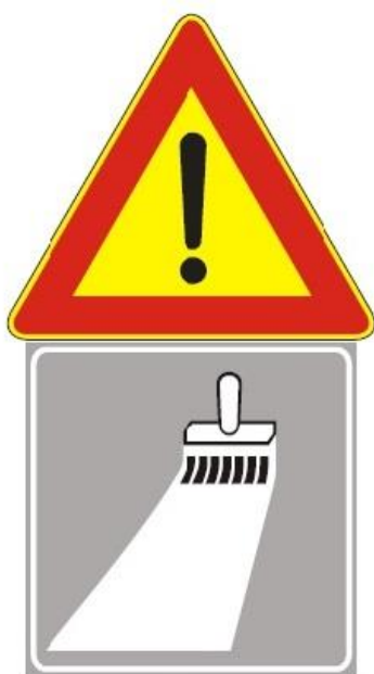
Figura II 391 Art. 31